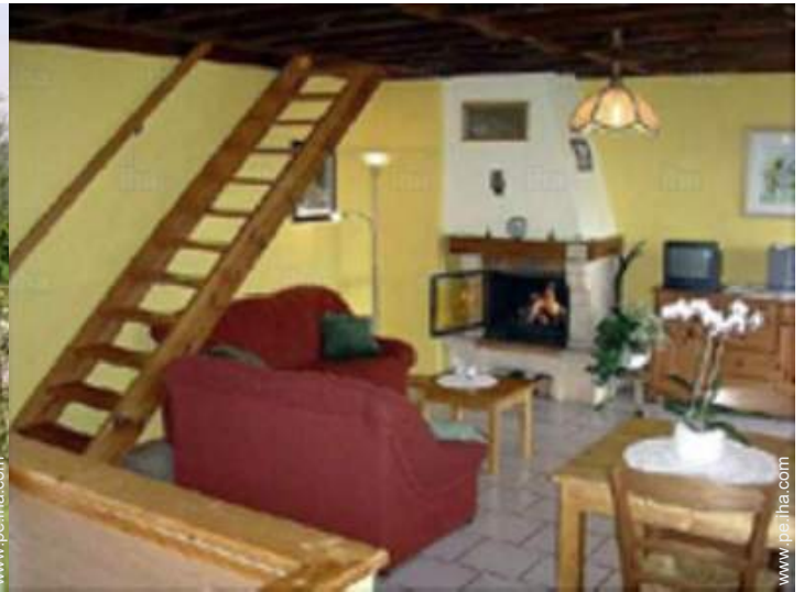
vista desde el cuarto de estar