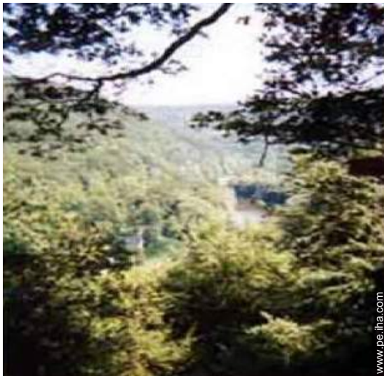
vista sobre el río