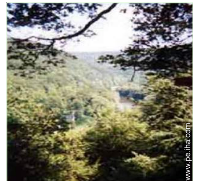
vista sobre el río