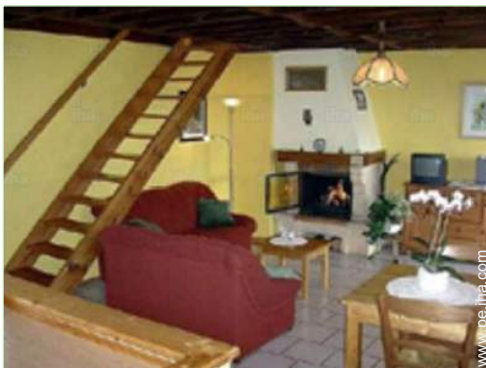
vista desde el cuarto de estar