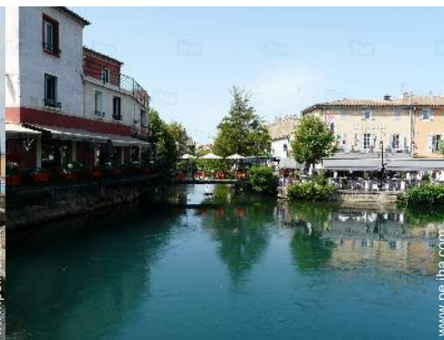
vista sobre la ciudad