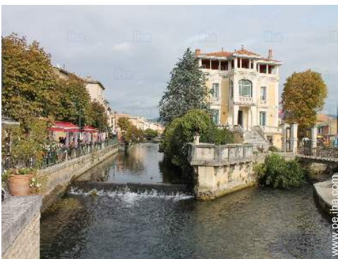
vista sobre el centro