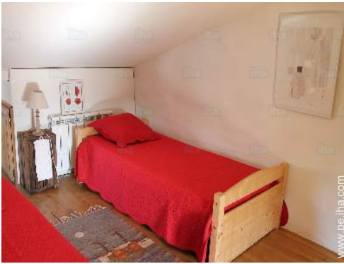
camas gemelas sencilla