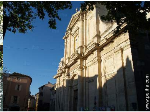
vista desde el apartamento