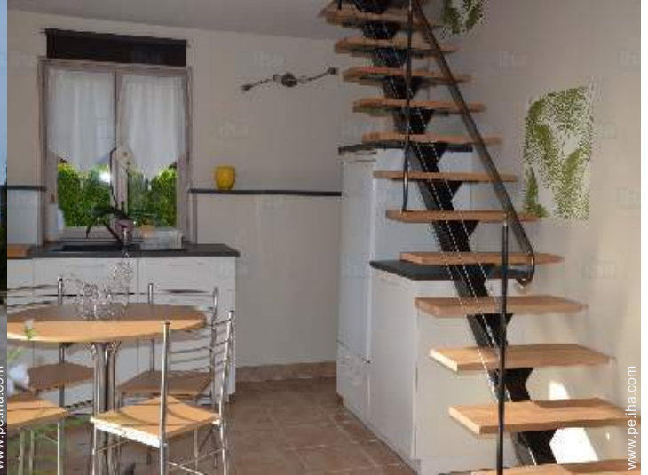
vista desde la cocina