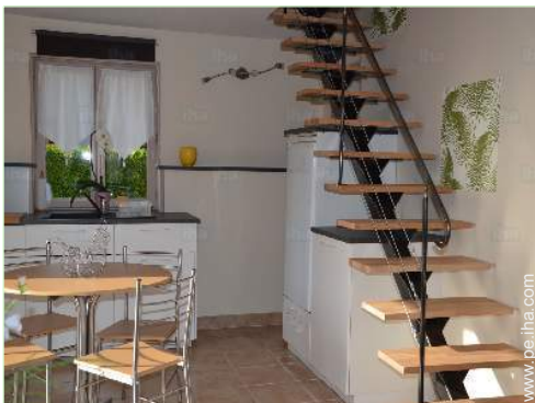
vista desde la cocina