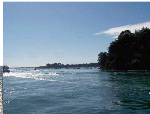
excursión en barco