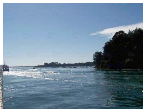
excursión en barco