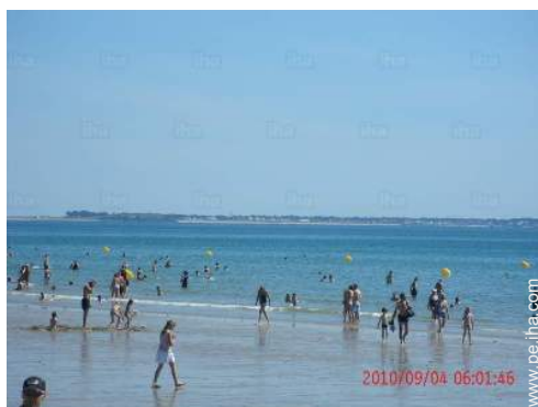
actividades balnearias cercanas