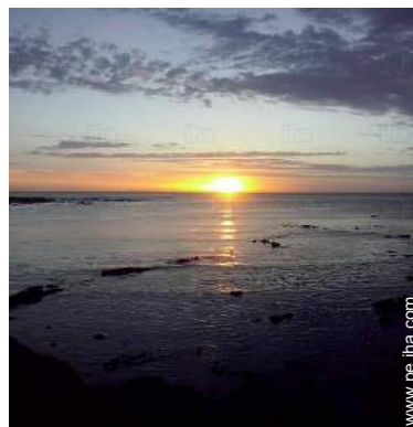
vista sobre el océano