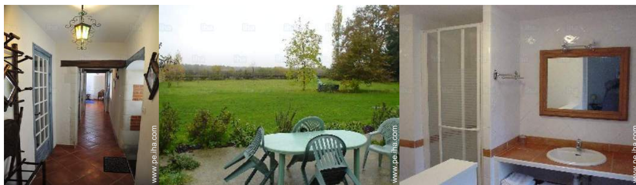
Disposición interior privado