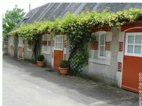
Casa de Piedra con Encanto

Comedor de bebé, bañera bebé, orinal bebé, parque infantil