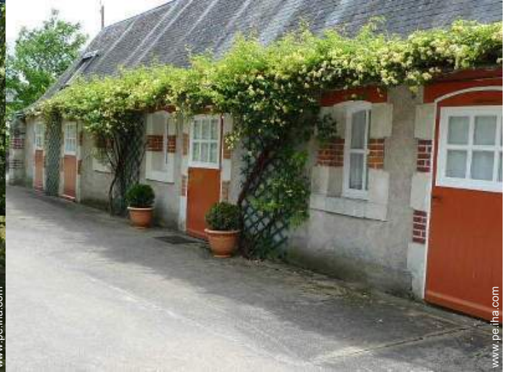
Casa de Piedra con Encanto