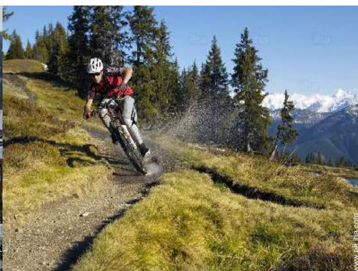
actividades de ocio de verano cercanas