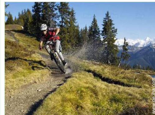
actividades de ocio de verano cercanas