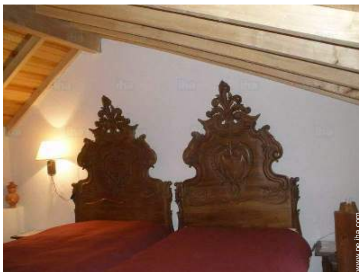
camas gemelas sencilla