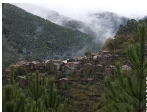
vista de conjunto