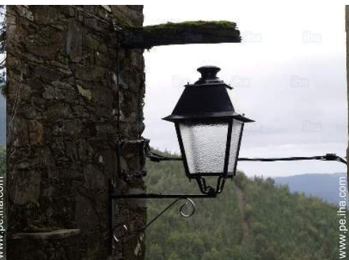
vista desde la casa