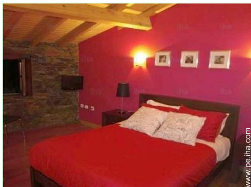
cama de matrimonio