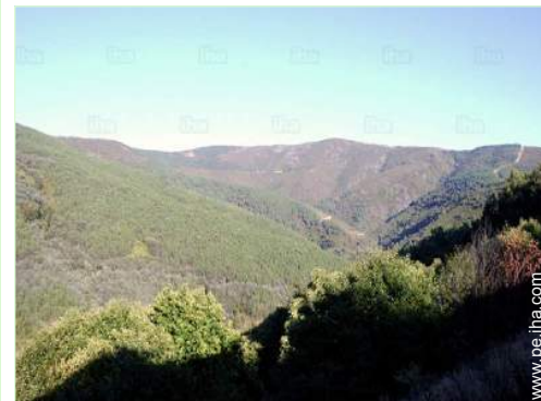
vista sobre la montaña