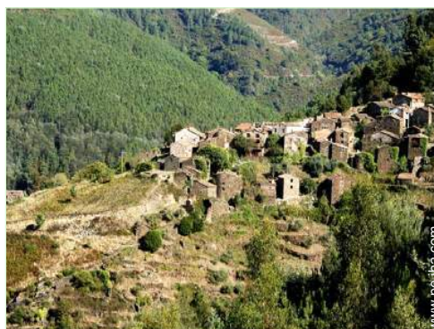
vista sobre el pueblo

Acondicionado para disminuidos : visual, auditivo