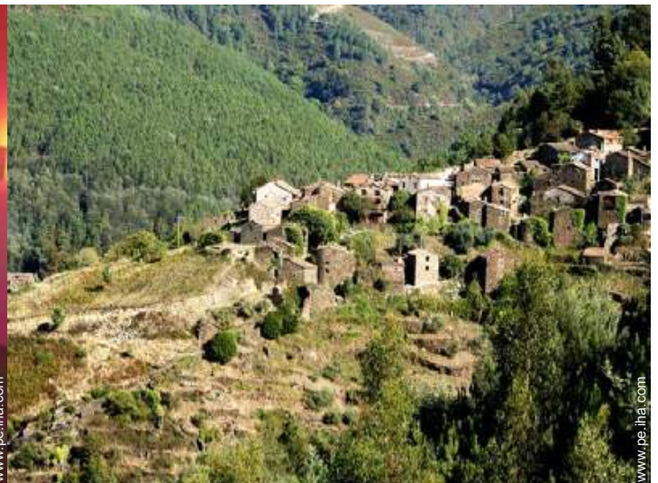
vista sobre el pueblo