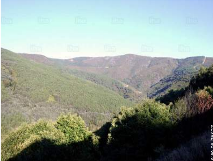
vista sobre la montaña