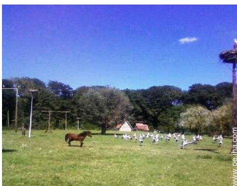
parque y jardín