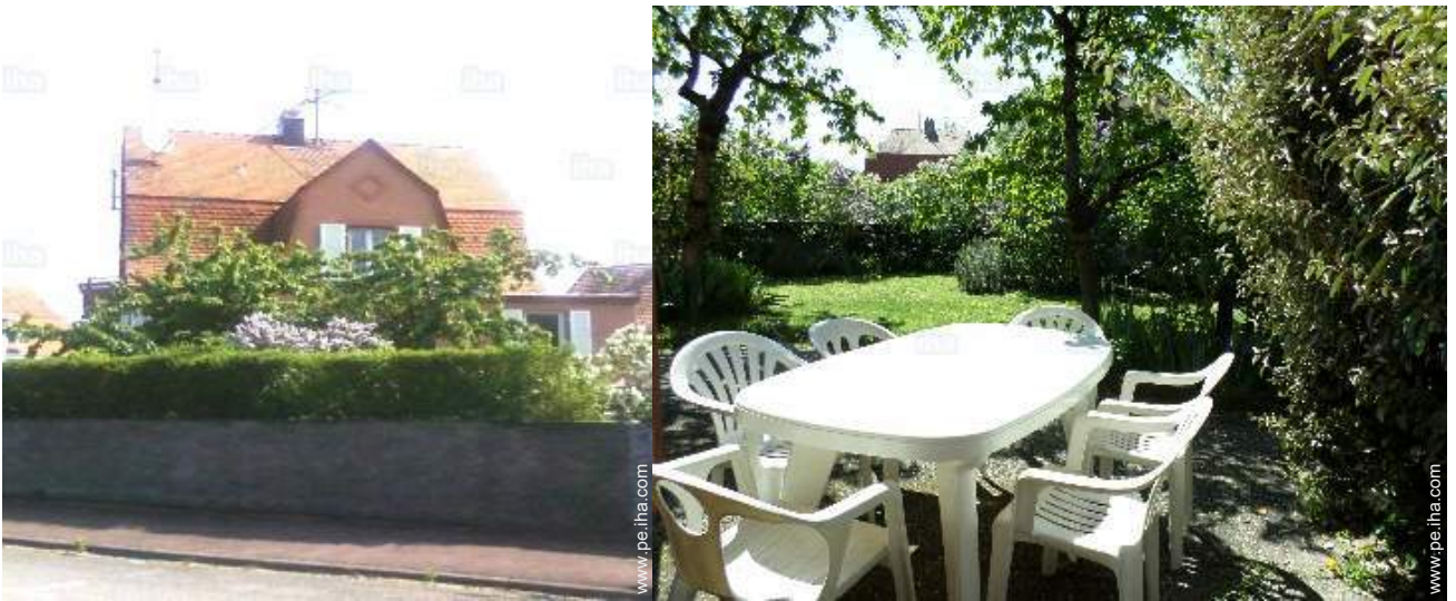
vista sobre el jardín/parque