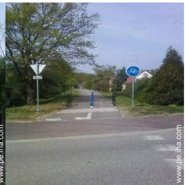
MTB (itinerario circuito)