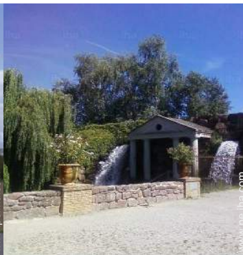
Zonas atractivas y relajación