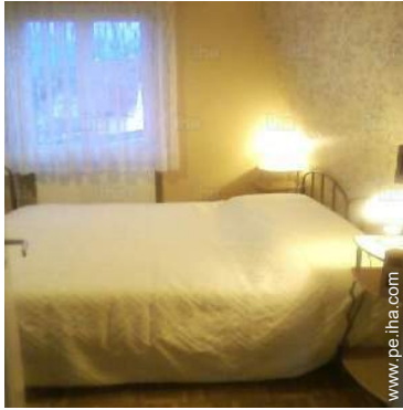
camas gemelas sencilla