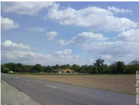
paseo a caballo