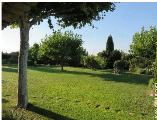
vista sobre el jardín/parque