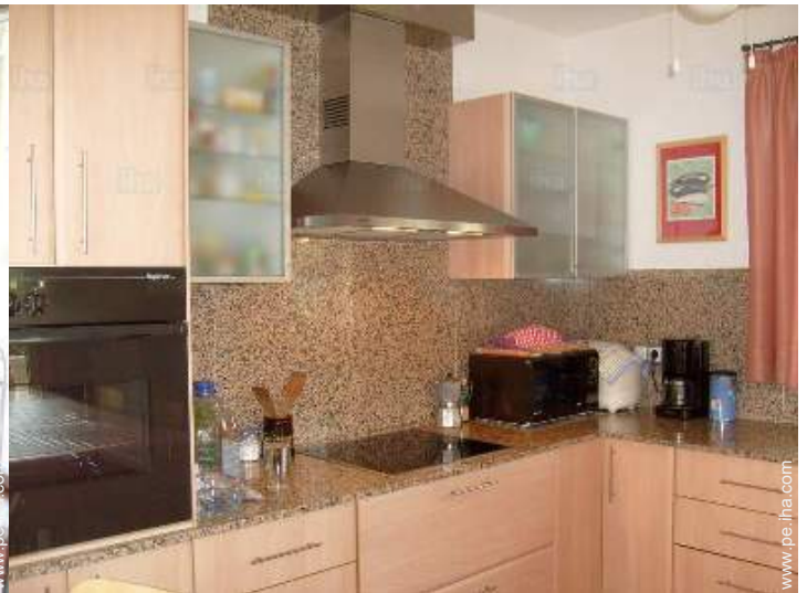
gran cocina americana