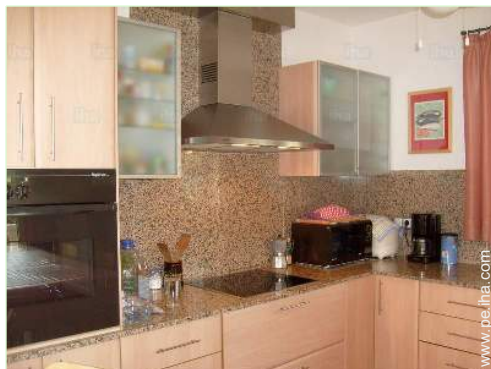
gran cocina americana