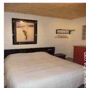
Estudio con Encanto

Terraza, terraza cubierta, solárium, parrilla, mesa (s) de jardín, 5 silla(s) de jardín, sombrilla, 2 reposera(s)