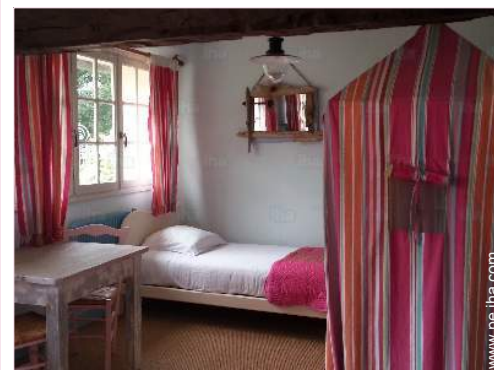
La habitación de huésped

Centro del pueblo 1,5km El centro 5km Alquiler de bici/MTB 5km Alquiler de carro 5km Panadería 3km Catering 5km Pequeños comercios 5km Supermercado 5km Comercios de lujo y de marcas 5km Peluquería 5km Cibercafé 4km Correos 5km Banco 5km Cajero automático 5km Farmacia 5km Doctor 5km Enfermera 5km Hospital 5km