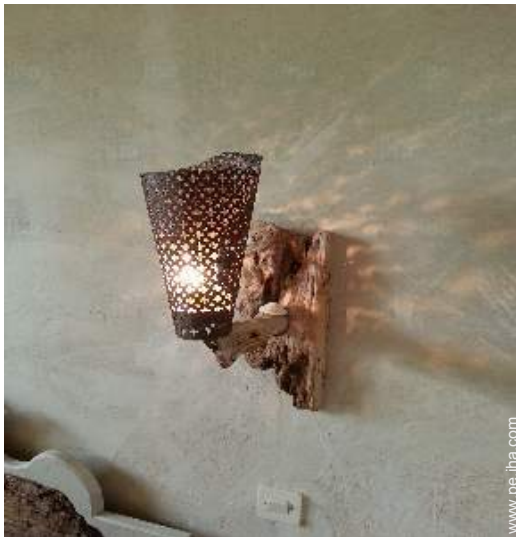
La habitación de huésped