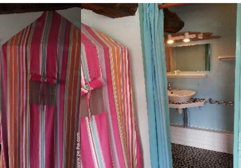
La habitación de huésped